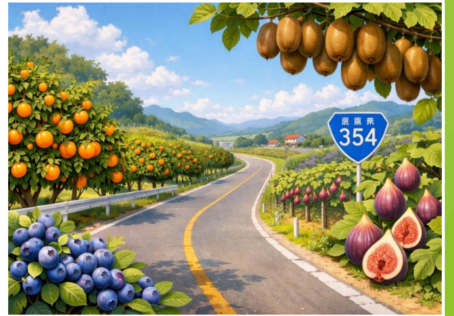
玉村町が目指す将来像のイメージ (AI生成による)