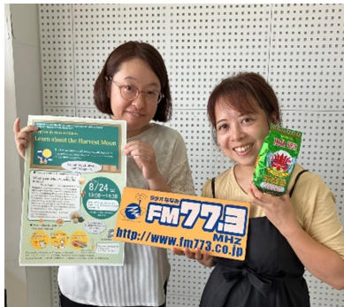
ラヂオななみにも出演しました！

9月のお月見イベントもお子さまが楽しめる企画を用意しています。ぜひ遊びに来ててくださいね！！