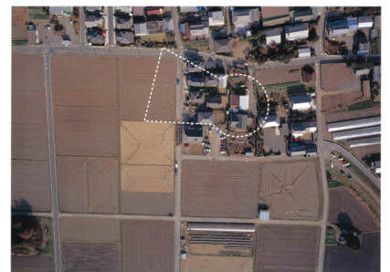
5. オトカ塚古墳推定範囲(左下は磐ノ木山古墳)