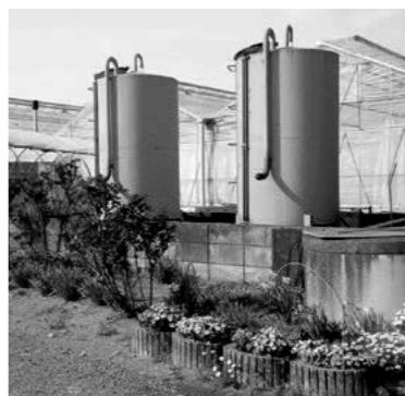
園芸農家の燃料費を支援

施設園芸農家に対し、高騰する燃料費を補助し負担軽減を図ることにより、事業継続の支援を行います。