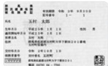
新しい保険証の色は茶色です