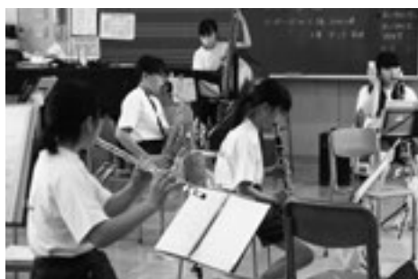
それぞれのパートで自分を磨く