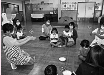
▲クルクルキラキラ☆ 割れないシャボン玉製作

7月16日、涼しくちよいどいい風が吹くシャボン玉日和にたくさんのお親子・幼児のお友達が参加し、とても賑やかに行うことができました。大きなシャボン玉やモコモコのシャボン玉、児童館のお庭がメルヘンの世界に包まれました♪ シャボン玉遊びの後は「割れないシャボン玉」を製作しました。回すとクルクルキラキラと光り、みんなとっても嬉しそうでした♪