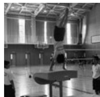
こんな華麗な技もできるように！