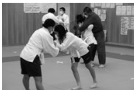
仲間と協力し合い、お互いを高め合う