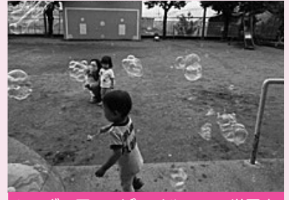
シャボン玉いっぱいメルヘンの世界☆