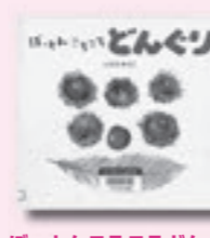
ぼっとなころころどんぐり いわさきゆうこさく 著 童心社

秋にひろくぬぎのどんぐりは、春や夏、どうなってるの? ぬぎのどんぐりがどうやって生まれ、新しい木に育つのか、迫力あるイラストで紹介。どんぐりクッキーのつくり方、どんぐりを使った遊びなども掲載する。