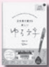
万年筆で書ける楽しいゆる文字 うたがわくさみ 宇田川一美 著 実務教育出版

万年筆で「ゆる文字」を書いてみませんか。かわいくて個性的な「ゆる文字フォント」を紹介するほか、ゆるイラストの書き方、ゆるローマ字フォント集なども収録。取り外せる練習帳つき。