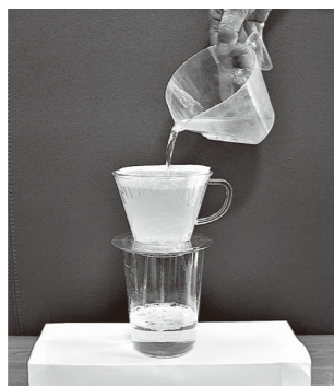
コーヒーフィルターを利用した簡易水質検査

答弁 環境安全課長 単独浄化槽でも、検査を実施していれば基準の性能が出ていると考えるが、浄化槽設置者には下水道への接続を呼びかけていく。単独浄化槽はトイレのみの浄化のため、合併浄化