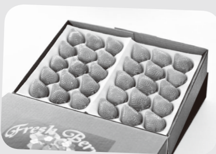
玉村町の返礼品に新たに加わったイチゴ

主な内容 地方税法等の改正に伴い、ふるさと納税制度が見直されます。令和元年6月1日からは、ふるさと納税の対象となる自治体を総務大臣が指定し、指定を受けない自治体への寄附金はふるさと納税の対象外とします。