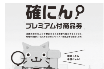
プレミアム付商品券回覧用チラシ

問 この事業の目的は。 答 消費税率の引き上げが家計に与える影響を緩和し、地域における消費を喚起することなどを目的としている。