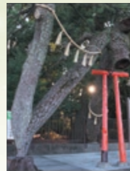
一般部門 佳作 「昇龍・勝運の松」 邑楽郡大泉町 对比地 連吉