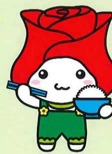
玉村町マスコットキャラクター「たまたん」