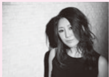
グレース・マーヤ（ボーカル）

7月7日（日）午後3時開演（午後2時30分開場） 全自由席2,500円 高校生以下1,000円（未就学児不可） 毎回大好評のエンジョイジャズ！！ 今回も日本JAZZボーカル界において今最も注目を集める「グレース・マーヤ」を迎えて、福田重男スペシャルカルテットの心地よいビートをお楽しみいただきます。レッツ！エンジョイ・ジャズ！！ 予定曲目：マイファニー・バレンタイン／オーバーザレインボー／フライミートゥザムーン／ミスティ／A列車で行こう ほか