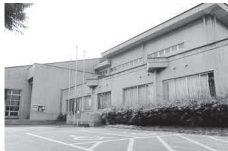
利用者が多い社会体育館

社会体育館長寿命化改修調査事業 400万円 社会体育館の老朽化に対応するため、今後の利用を考慮した長寿命化に向け調査を実施します。