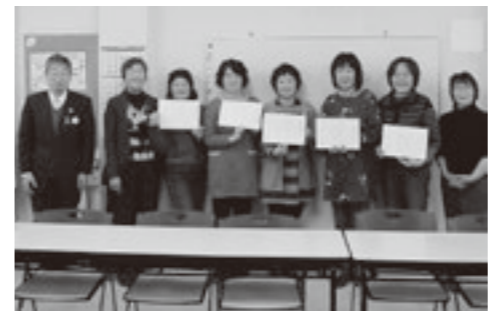
修了証書を手にする受講者の皆さん

玉村スポーツチャンバラ教室参加者募集 誰でもできるスポーツチャンバラに挑戦してみませんか! 日時 4月13日(土)、20日(土) 午後5時30分~7時まで 場所 ふるさとホール 参加費 無料 申し込み 当日、直接会場へお越しください。 対象者 幼児からシニアまで、親子、兄弟、誰でもOKです。 問い合わせ先 上武館スポーツチャンバラクラブ ☎090(9371)5096 平成31年度 文化庁伝統文化親子教室事業 玉村八幡宮茶道会 玉村八幡宮茶道会では、親子茶道教室を開催します。日本の伝統文化を体験して、礼儀作法や美しい立ち振る舞いを身につけてみませんか? 対象 小学生と保護者 開催日 4月7日・14日、5月12日・19日、6月2日・9日、7月7日・21日、8月4日・18日、9月8日・22日、10月6日、11月3日・17日、12月8日