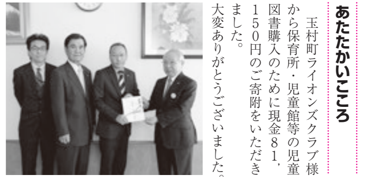
玉村町ライオンズクラブ様から保育所・児童館等の児童図書購入のために現金81,150円のご寄附をいただきました。大変ありがとうございました。