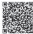
会員募集用QRコード