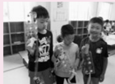
▲たまごパックでけんだまを作ったよ

6月20日、北部公園へ遊びに行く予定でしたが、残念なことに朝から大雨。予定を変更して、児童館にてバスごっこをしたり、かざぐるまを回して遊んだり、パネルシアターを観て楽しみました。