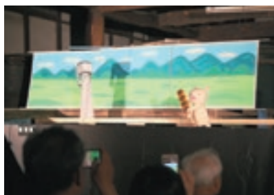
サカグラザ 4月21日 県立女子大学の学生によるオリジ ナル人形劇などが町田酒造で行わ れた。