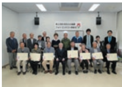
フォトコンテスト表彰式 4月14日 町の風景、祭りなどを題材とした フォトコンテストの表彰式が行わ れた。(関連記事P.2~3)