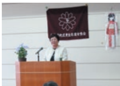
更生保護女性会総会 4月17日 群馬県仏教保護会の再犯防止活動 についての講演で、社会復帰への 取り組みを学んだ。