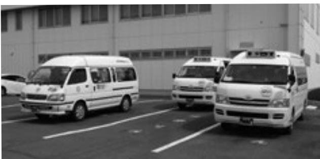
6路線で運行している「たまりん」