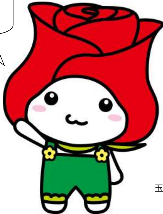
玉村町マスコットキャラクター 「たまたん」