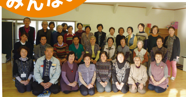
楽しく活動しています