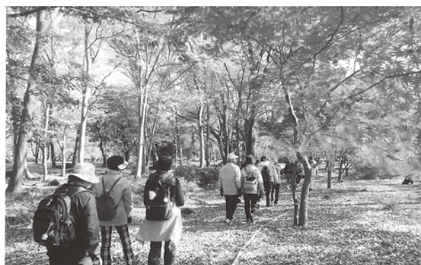
水辺の森 秋のフォレストウォーキング

これからは、大学や高校、企業との連携体制づくりの強化が必要になる。ますます少子高齢化が進む地域で、住民活動の拠