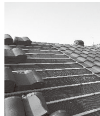
住宅屋根のリフォーム

答弁 町長 この制度は、地域経済活性化の推進を目的に、緊急経済対策事業としてスタートしたが、平成26年度で終了している。4年間で1417件の利用があり、工事費も12億円と活用された。