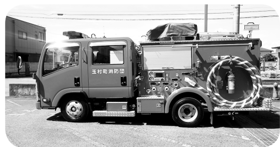
最新鋭小型消防ポンプ自動車

主要内容 平成7年から使用している第10分団の消防ポンプ自動車を、照明設備等を搭載しオートマチック仕様の最新鋭小型消防ポンプ自動車に更新します。