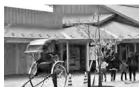
創意工夫で経費節減