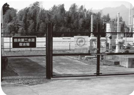
県央第二水道取水場（渋川市旧北橋村）

A 町長 第5次総合計画でも人口問題は最重要課題だが、市街化調整区域の開発は問題も多い。今後さらに研究したい。