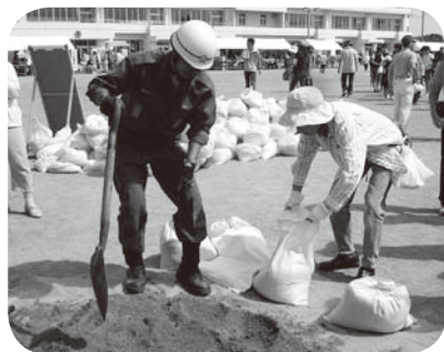
地域防災訓練での土のうづくり体験

A 町長 対象企業を選定して協定を結ぶとともに、防災訓練にも参加していただくように調整する。