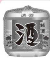
飲食物の差し入れ