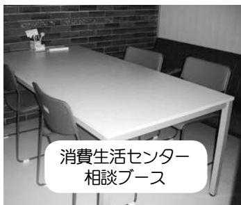
消費生活センター 相談ブース

相談件数は223件、特に男性からの相談が多く、多重債務やネット被害、クーリングオフなどの内容が多数を占めている。また、筋トレ会場等に出向き、高齢者に振り込め詐欺被害防止などについての啓発を行うなどの活動も実施している。