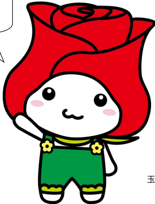
玉村町マスコットキャラクター 「たまたん」