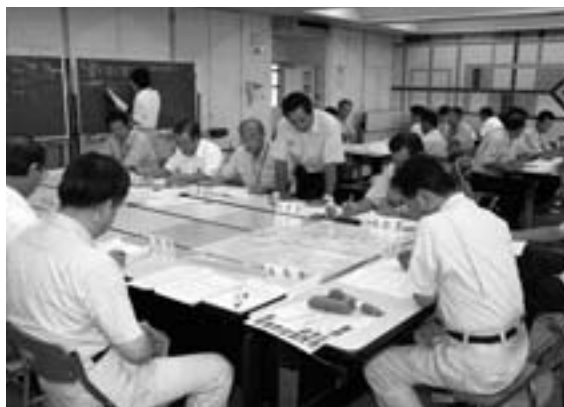
地図上で災害時の動きを想定する図上訓練 (H18.9.1実施 玉村町役場)