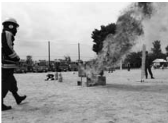
イベントを兼ねて行われた防災訓練 (H19.9.2実施 芝根小学校)