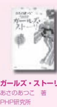
ガールズ・ストーリー あさのあつこ 著 PHP研究所

申し込み 2月15日(月)から26日(金)までに参加費を添えて直接学校給食センターへ。※電話予約は受け付けていません。