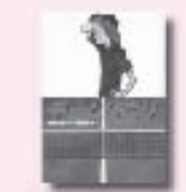
チームひとり よしのまゆこ 吉野万理子 作 宮尾和孝 絵 学研教育出版

江戸深川で、医師である父の仕事を手伝うおいち、この世に思いを残して死んでいった人の姿が見える。この力を誰かのために生かしたいと願うおいちの夢に、助けを求める女が現れ…。『文蔵』連載「当世使娘物語」を単行本化。