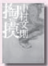
すり 掏摸 なからふみおのり 中村文則 著 河出書房新社