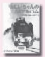
おじいちゃんのSLアルバム ささきたかし 佐竹保雄 写真・原案 小風さち 文 福音館書店

東京を仕事場にする天才スリ師は、闇社会に生きる「最悪」の男・木崎と再会し、仕事を依頼される。「これから3つの仕事をこなせ。失敗すれば、お前を殺す」その瞬間、木崎は彼にとって絶対的な運命の支配者となった。