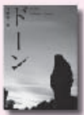
ドーン ひらのけいいちろう 平野啓一郎 著 講談社

2033年、人類で初めて火星に降り立った宇宙飛行士、佐野明日人。しかし、宇宙船「ドーン」の中ではある事件が起きていた。世界的英雄となった明日人を巻き込む人類史を揺るがす秘密とは？