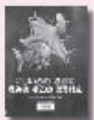
にじいろの さかなうみの そのの ぼうけん マーカス・フィスター 作 谷川俊太郎 訳 講談社

「きらきらうろこを落としちゃった!」にじゅうおは、うろこを追って海の底へ。光もなく、知らない生き物のすむ世界で、にじゅうおは、自分のうろこを見つけ出すことができるのでしょうか? 「にじいろのさかな」シリーズ第6弾