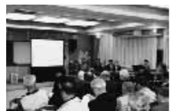
町長座談会のようす