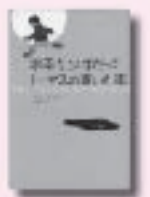
不幸な少年だったトーマスの書いた本 フース・コイヤー 著 のさかえつこ 野坂悦子 訳 あすなろ書房

天災ですべてを失った中学生の信之。共に生き残った幼なじみの美花を救うため、彼はある行動をとる。20年後、過去を封印して暮らす信之の前に、もうひとりの生き残り、輔が姿を現わす…。日常にひそむ暴力を描く渾身の長編。