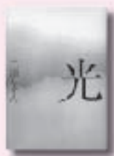
光 みづる 三浦しをん 著 集英社