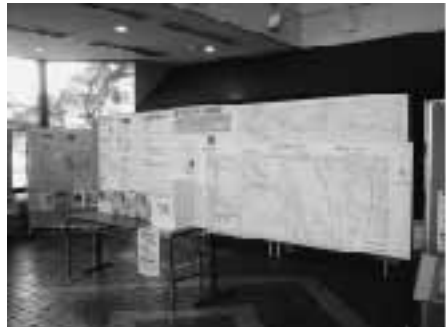
事業紹介のパネルの様子

完成してからでは意見を反映させることはできませんので、この住民参画手法を目にしましたら、みなさんの積極的な参画をお持ちしています。