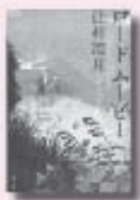
ロードムービー つとむつ ふしむし 辻村深月 著 講談社