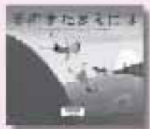
そのまたまえには ブルース・イングマン アラン・アルバーク作 小学館

絶縁状態の父、不審な死を遂げた母、自ら命を絶った兄。そして消えた保険金1億5千万円……。家族の秘密が暴かれるとき、運命の歯車が回り出す。