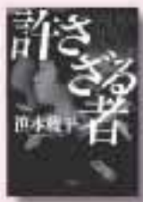
許さざる者 ミヤモトリツコ 笹本稜平 著 幻冬舎