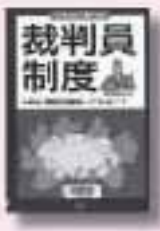
イラストで学べる裁判員制度 第1巻 裁判員制度研究会 著 汐文社

2009年5月から実施される裁判員制度は、民間人が抽選で選ばれて裁判官と一緒に裁判を行う新しいしくみ。裁判員になるとどんなことをするのか? 選ばれると断れない? 裁判員制度のしくみをわかりやすくイラストで説明。