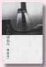
てれんぱれん せいしんぱれん 青来有一 著 文藝春秋

父よ、あなたは何を見てしまったのですか? てれんぱれんと頼りなく生きてきた父親には不思議な力が備わっていた。ある日、「わたし」に謎の女性が近づく。被爆地を舞台にした、心を揺さぶる物語。