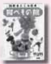
21世紀子ども百科 食べもの館 小学館

伯父の家に住みついた「魔女」を追い出そうとアメリカにむかったばく。ところが、そのひとは人見知り、やせっぽちで、正直で...。すてきな恋の物語「asta」連載「ギャングスタとさくらんぼ」を改題し単行本化