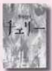
チェリー のなか野中ともそ 著 ポプラ社