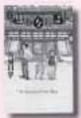
鹿男あをによし 万城目 学 著 幼冬舎

テキスト代 4,000円 申し込み 6月18日(月)から29日(金)までの午前8時30分から午後5時15分まで(土日を除く)にテキスト代を添えて消防本部予防課へ 無料公開講座