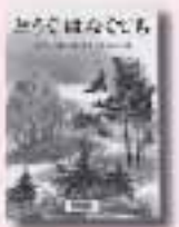
どうぐはなくても N・チャルーシナ 絵 V・ピアンキ原作 福音館書店

「さあ、神無月だー。出番だよ、先生」2学期限定で奈良の女子高に赴任した28歳の「おれ」ちよびり神経質な彼に下された、空前絶後の救国指令とは!? ユーモアがちりばめられた渾身の書き下ろし。