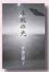
水底の光 小池真理子 著 文藝春秋

献血カードをお持ちでない人は、新しく発行しますので身分証明書の提示をお願いします。また、献血手帳をお持ちの人も、当日持参してください。