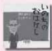
いのちのおはなし 村上康成 絵 日野原重明 文 講談社

パレ・ロワイヤルの灯、真夜中の東京タワー、漆黒の闇に乱舞する螢、白い霧に溶けてゆく火花…。イルミネーションに託して、ひとりて生きる女たちの仄かなプライドを描いた短編集