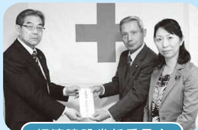
経済建設常任委員会