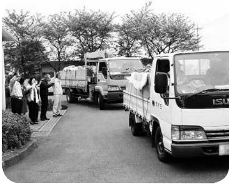
被災地へ向かうリサイクル自転車

地震防災マップ・防災訓練・防災倉庫内の備蓄食料・防災行政無線などを再度確認し、いざという時にそれを有効に活用できるように努力されたい。