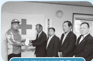
文教福祉常任委員会

玉村町議会は、日本赤十字群馬県支部を通して、東日本大震災の被災地に義援金を送っています。義援金は、議員の募金によるもので、震災発生後の3月に、1人6万円（総額96万円）を送りました。今後も、9月まで毎月1人1万円（月16万円）を継続して送っていきます。（4月以降、各常任委員会が毎月交代で日赤へ届けています。）