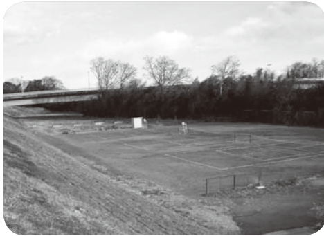
玉村大橋下の仮設テニスコート

A 町長 玉村中学校の改築も終わった。県の許可が得られれば、新年度から一般のソフトテニス愛好者に開放していきたい。