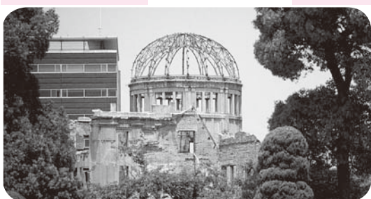
※広島体験研修 各小中学校から男女各1名を、平和記念式典にあわせて広島へ派遣し、平和に関する体験的な研修に参加させることにより、時代を担う心豊かな青少年の育成を目指す。

Q 教育長 研修の内容や方法などを、さらに工夫・改善する。継続させてほしい。 A 教育長 研修は、反戦・反核運動の洗脳教育であり、左翼思想の偏向教育ではないか。