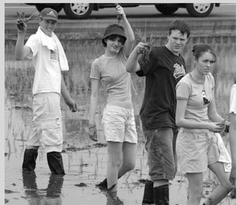
初めての田植え体験(エレンズバーグの子どもたち)