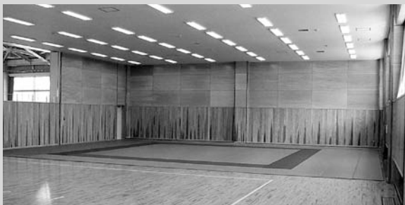
玉村中学校武道場(体育館2階)